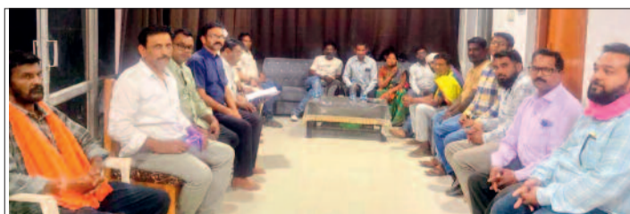
हरिभूमि न्यूज ►► मैनपुर